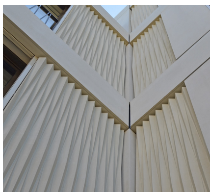
MFH, mit ineinander laufenden Dreiecken, Frohalpstrasse, 8038 Zürich